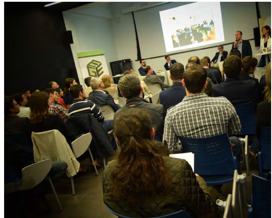
Memoria ejecutiva Mes del Emprendimiento Almendralejo 2017

Residencia Vivero Emprendedores Europeos